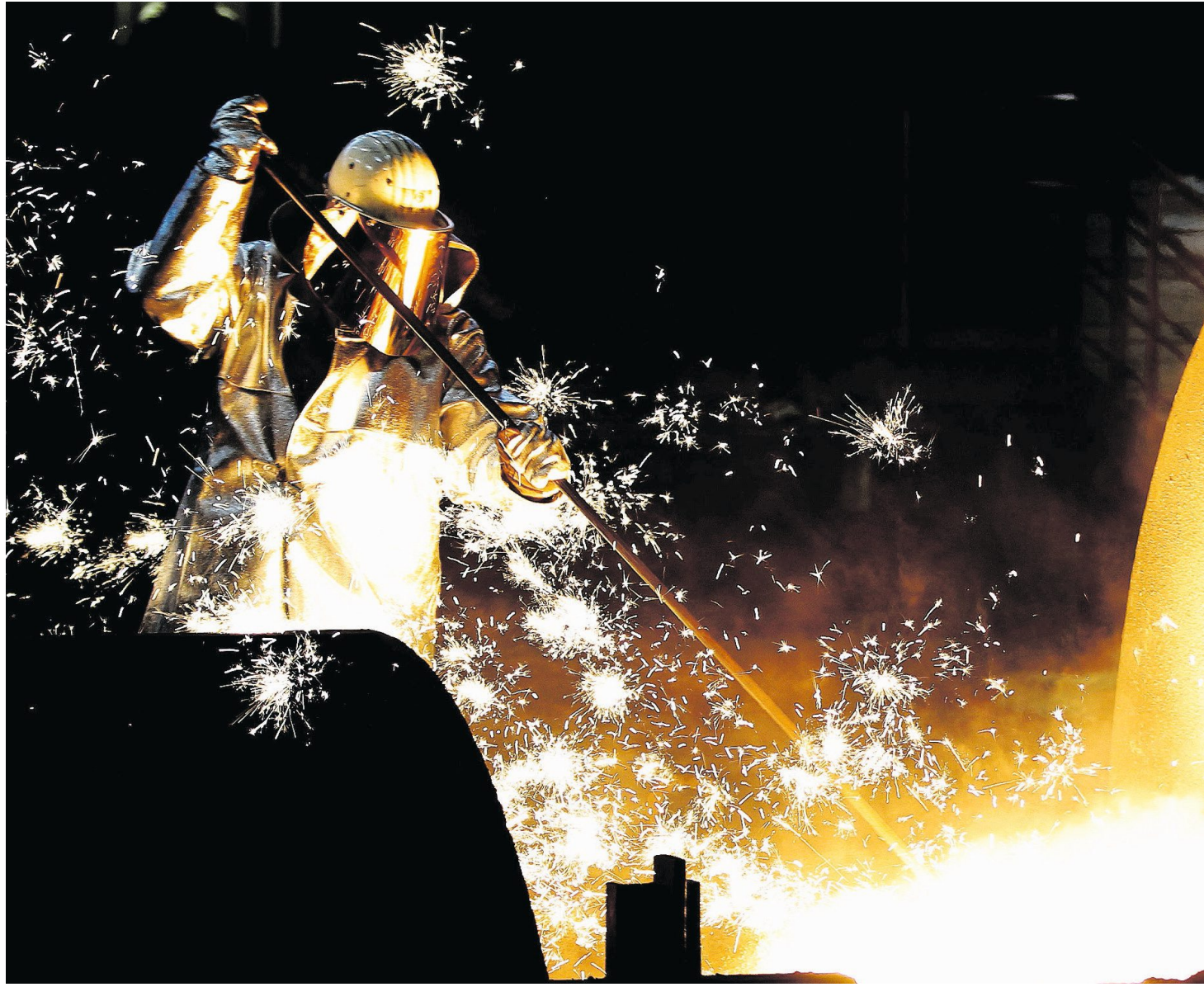
Ein Funkenregen begleitet die Stahlschmelze im grössten Stahlwerk Europas, betrieben von Thyssen-Krupp. (Duisburg, 6. Dezember 2012)